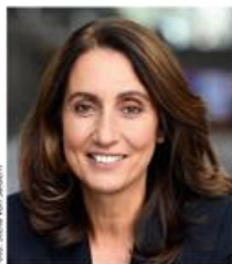
Aydan Özoguz SPD